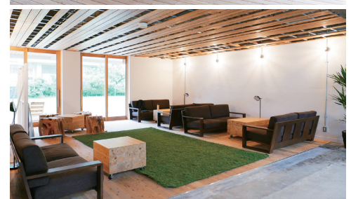
上/武雄市図書館、中・下/ SAGA FURUYU CAMP