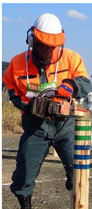
（輪切りリレー競技）