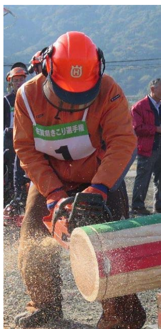
（丸太合せ輪切り競技）