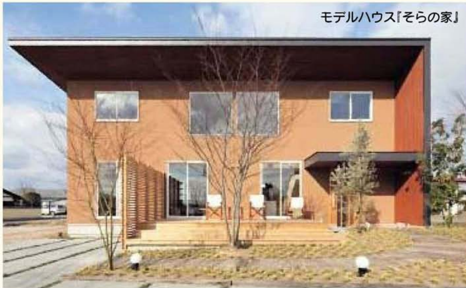
モデルハウス「その家」

福田建設株式会社は、木造住宅や社寺仏閣など、多くの建築を手がけられています。より多くのお客様に「くつろぎとやすらぎのある快適な住まい」を提供できるよう品質の良い木材を使った住まいづくりに取り組まれています。