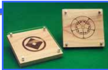
県産木材家紋 縦15cm 横15cm 厚さ2cm