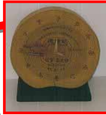
県産木材 置き時計 直径19~22cm 厚さ8cm