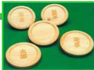
県産木材ドリンクコースター (5個セット) 直径10cm 厚さ1.5cm