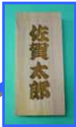
県産木材表札 縦21.2cm 横8.8cm 厚さ3cm